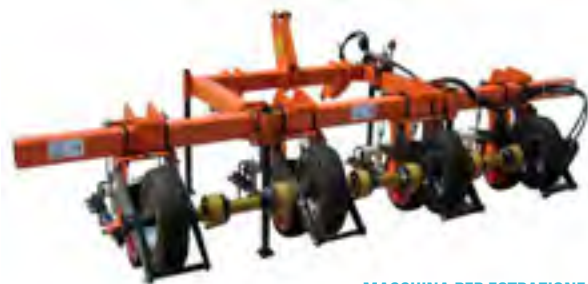
MACCHINA PER ESTRAZIONE ALA LEGGERA